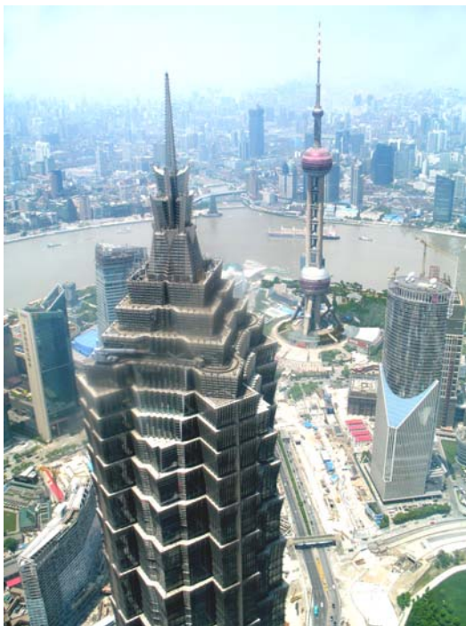
Shanghai Photo gm 2009

Im Zuge des weltweiten Ausbaus unseres interkontinentalen Netzwerks wurde Anfang Mai 2009 ein Joint Venture in Hong Kong und Taiwan gegründet.